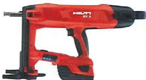
图 1a 喜利得 BX 3 工具

在长时间使用后,在某些情况下,工具(图 1a)可能会出现意外的活塞释放,导致钉子(图 1b)意外射出 - 即使没有启动扳机。